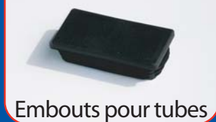
Embouts pour tubes